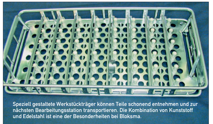
Speziell gestaltete Werkstückträger können Teile schonend entnehmen und zur nächsten Bearbeitungsstation transportieren. Die Kombination von Kunststoff und Edelstahl ist eine der Besonderheiten bei Bloksma.

Für den Materialfluss kommen nun aufeinander abgestimmte, zum Teil neu entwickelte Werkstückträger, Bodenroller, pneumatische Hebezeuge, Transportschränke und ein neu entwickeltes Schubgerät – der ‚Roadrunner‘ – zum Einsatz und sorgen für optimierte logistische Abläufe zwischen den Produktions- und Montagestationen.